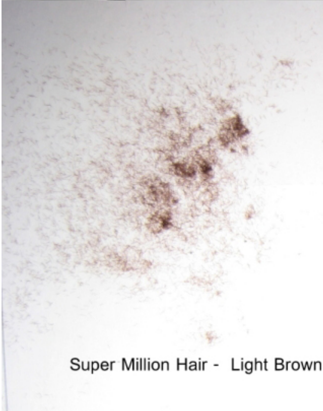
Super Million Hair - Light Brown