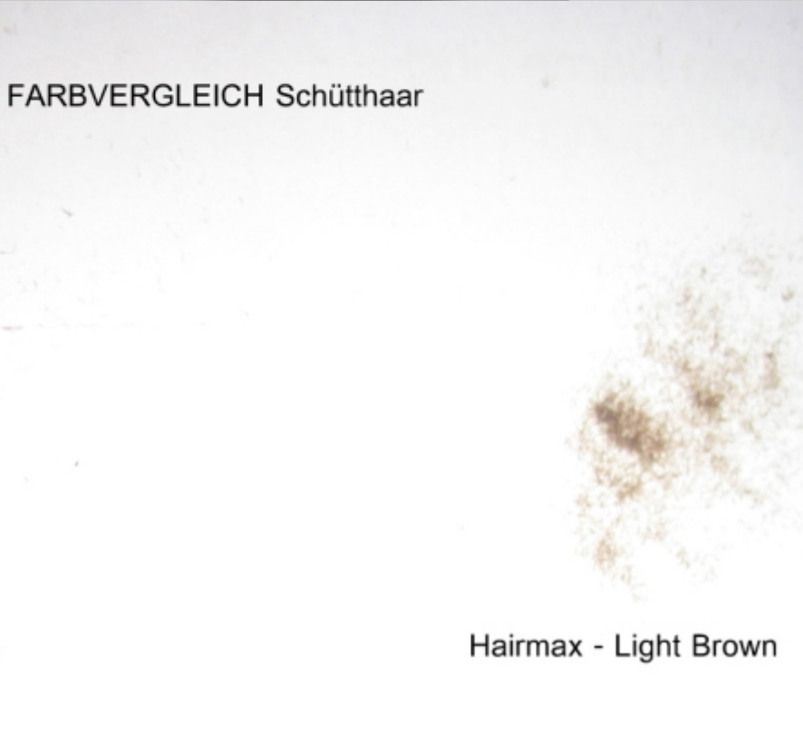
Hairmax - Light Brown

Subject: Aw: Schütthaar - Vergleich Posted by mrs.xy on Sun, 13 Nov 2011 18:59:19 GMT