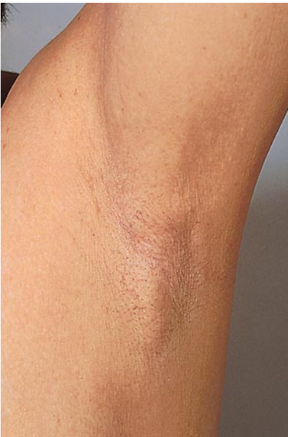
Abb. 3 ▲ Rarefizierung der Axillarbehaarung bei Hyperthyreose

und das Ahumada-del-Castillo-Argonz-Syndrom (Hyperprolaktinämie bei Nullipara ohne Nachweis eines Prolaktinoms).