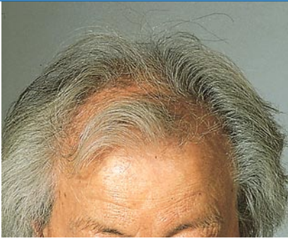
Abb. 1 ▲ AGA vom maskulinen Typ in der Postmenopause