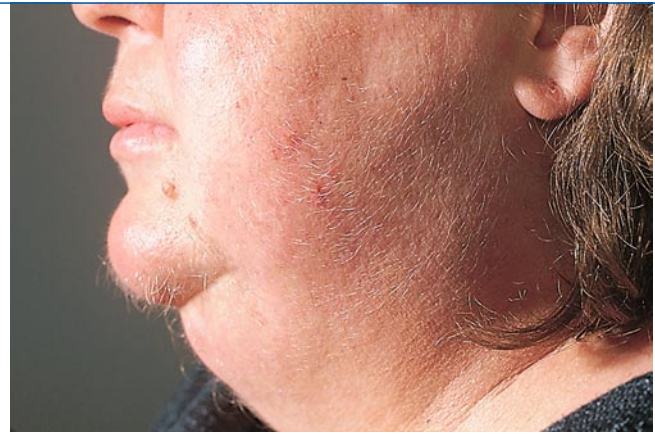
Abb. 4 ▶ Hypertrichose des Gesichts bei Hyperkortizismus

Die Bedeutung von Wachstumshormon (GH, Somatotropin) für die Haare wird ersichtlich aus der klinischen Beobachtung von Zuständen mit vermindertem bzw. vermehrtem GH. GH wirkt indirekt, indem es an den GH-Rezeptor bindet, der ein Transkriptionsfaktor ist und die Expression von IGF- („Insulin-like-Growth-Factor“-)1 erhöht. Dieses wiederum bindet an seinen Rezeptor IGF1-R, der ebenso ein Transkriptionsfaktor ist. Ist der GH-Rezeptor durch Mutationen verändert, dann sprechen die Zellen vermindert auf Somatotropin an. Man bezeichnet dies als Somatotropin-Resistenz oder Laron-Syndrom. Neben einem proportionierten Minderwuchs, der im Kleinkindalter manifest wird, zeichnet sich das