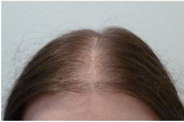
1. aktueller Status / Mittelscheitel