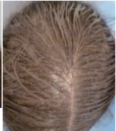
4. Dermmatch frisch aufgetragen